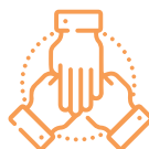
Associazioni di categoria